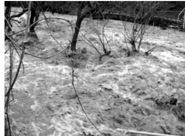
Ճանուղներ եւ ուղարկվել հետազոտության:

Դեպքի վայր են մեկնել Լուռու մարզային փրկարարական վարչության օպերատիվ խումբը եւ ԶԳ բնապահպանության նախարարության մարզային բնապահպանական պետական տեսչության աշխատակիցները: Գետից վերցվել են փոր-