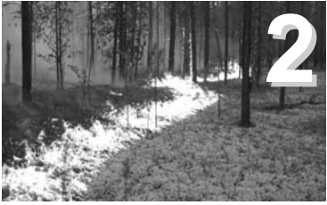
Անբառային հրդեհներ Ռուսաստանում