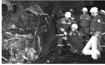
Խոշոր ավտովթար Երեւանում