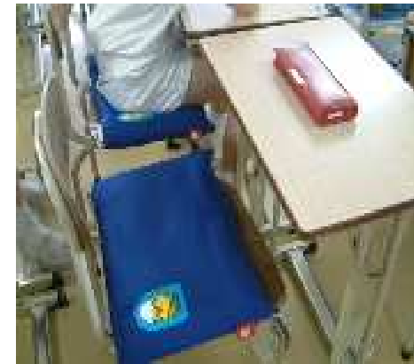
Protective hood as cushion