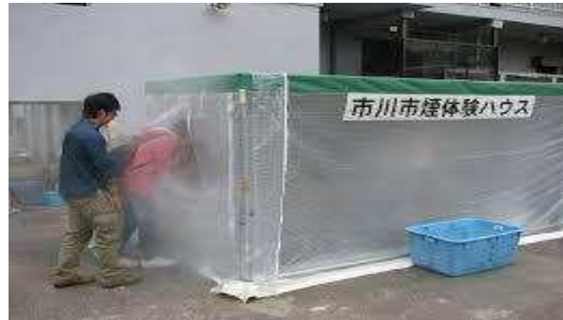
tent filled with smoke