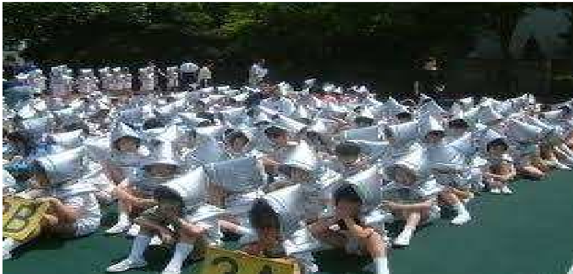
Children with protective hoods

Գլուխը պաշտպանող գլխարկ (protective hood)