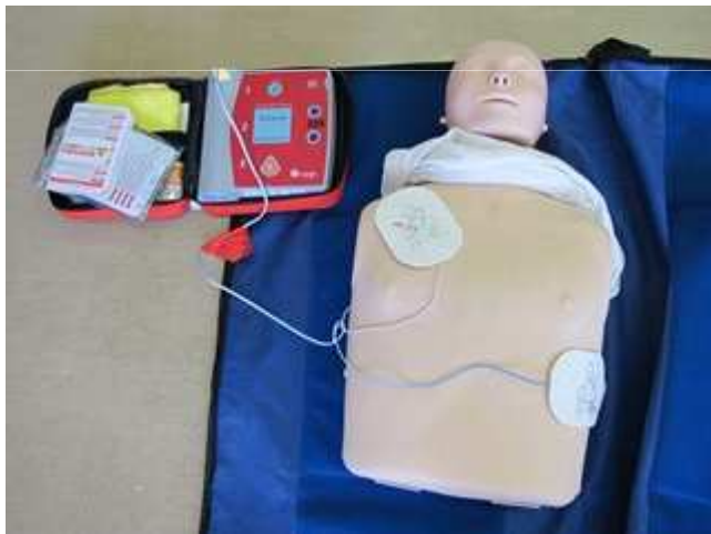
Automated External Defibrillator