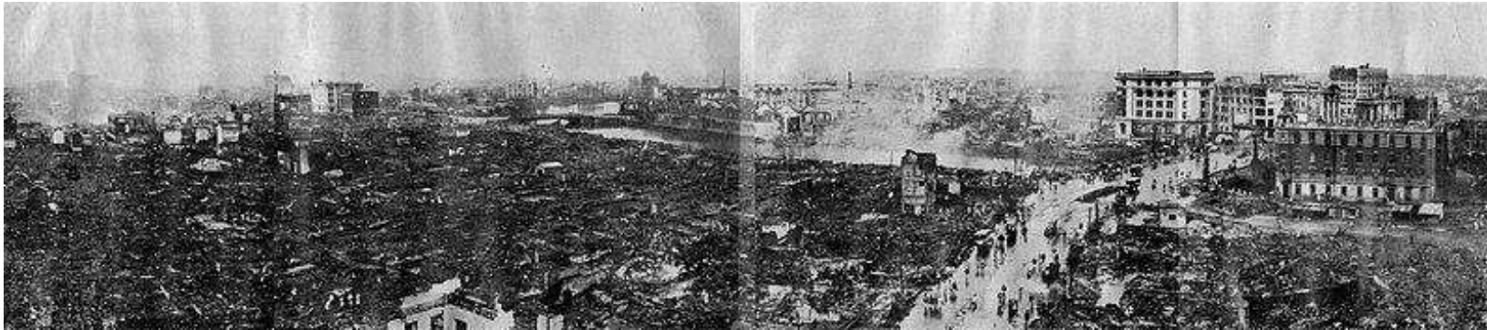
The center of Tokyo after the disasters