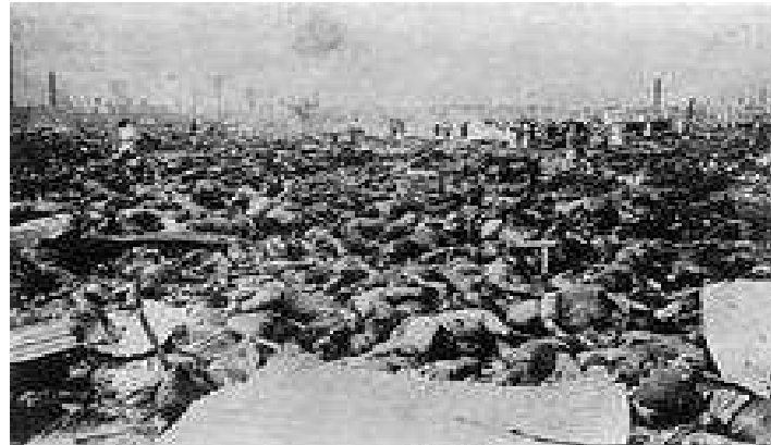
Rikugun Hihukusho Park after burned

Մոտավորապես 40000 հոգի մահացավ այս օթևանում